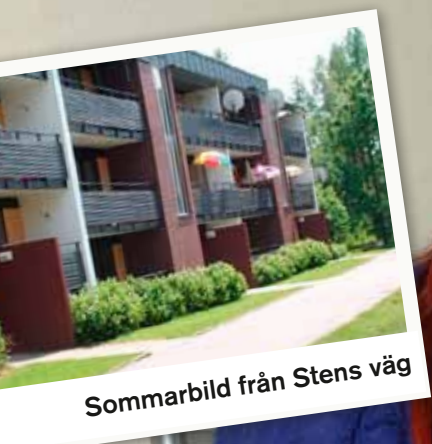
Sommarbild från Stens väg

ETT NYHETSREVE FRÅN WITALABOSTÄDER · NR 1 2010